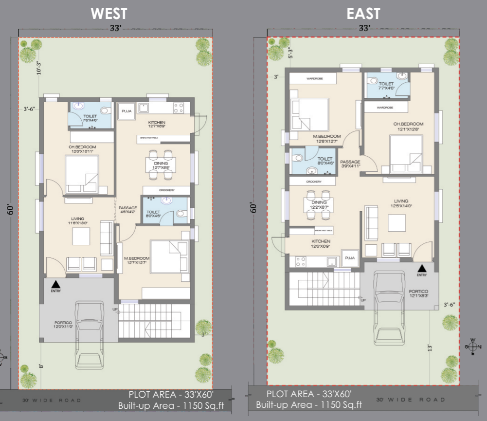
TYPICAL FLOOR PLAN